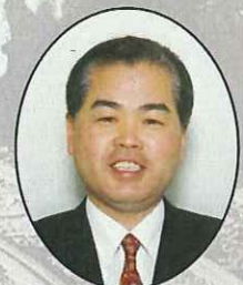
佐々木 龍 新居浜市長

お問い合わせ先：東予地方局 商工観光室 電話 0897-56-1300(代) / FAX 0897-56-1308 〒793-0042 愛媛県西条市喜多川 796 番地の 1 E-mail tou-syoko@pref.ehime.jp