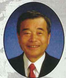
菅 良二 今治市長