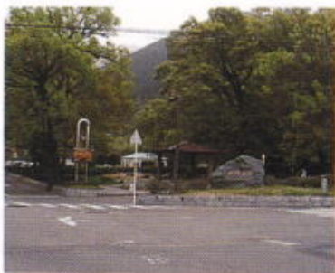
① ⑧ 山根公園

別子ライン入口に位置する。総合公園山根グラウンドは、別子銅山の運動会や相撲大会等でにぎわった所。